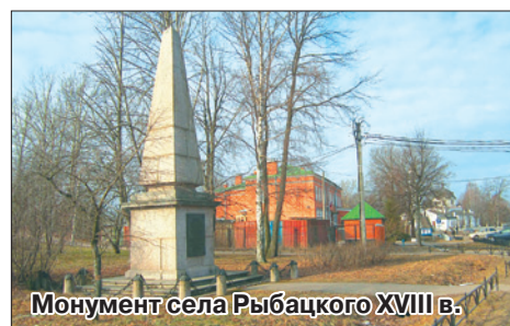
Монумент села Рыбацкого XVIII в.