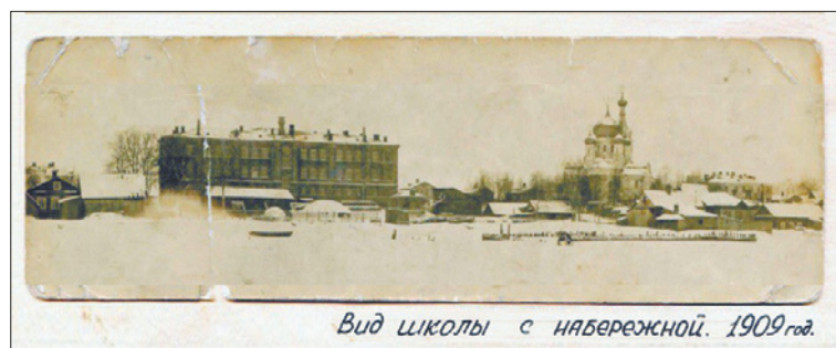
Вид школы с набережной. 1909 год.