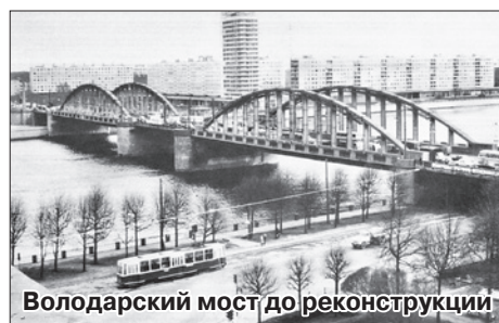
Володарский мост до реконструкции