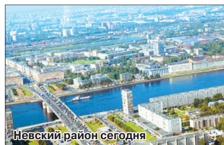
Невский район сегодня