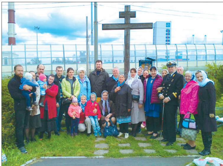
Верующие собираются у Поклонного креста в любую погоду, чаще – после работы, чтобы вместе с батюшкой принять участие в коллективной молитве.

В сентябре того же года инициативная группа обратилась в районную администрацию с