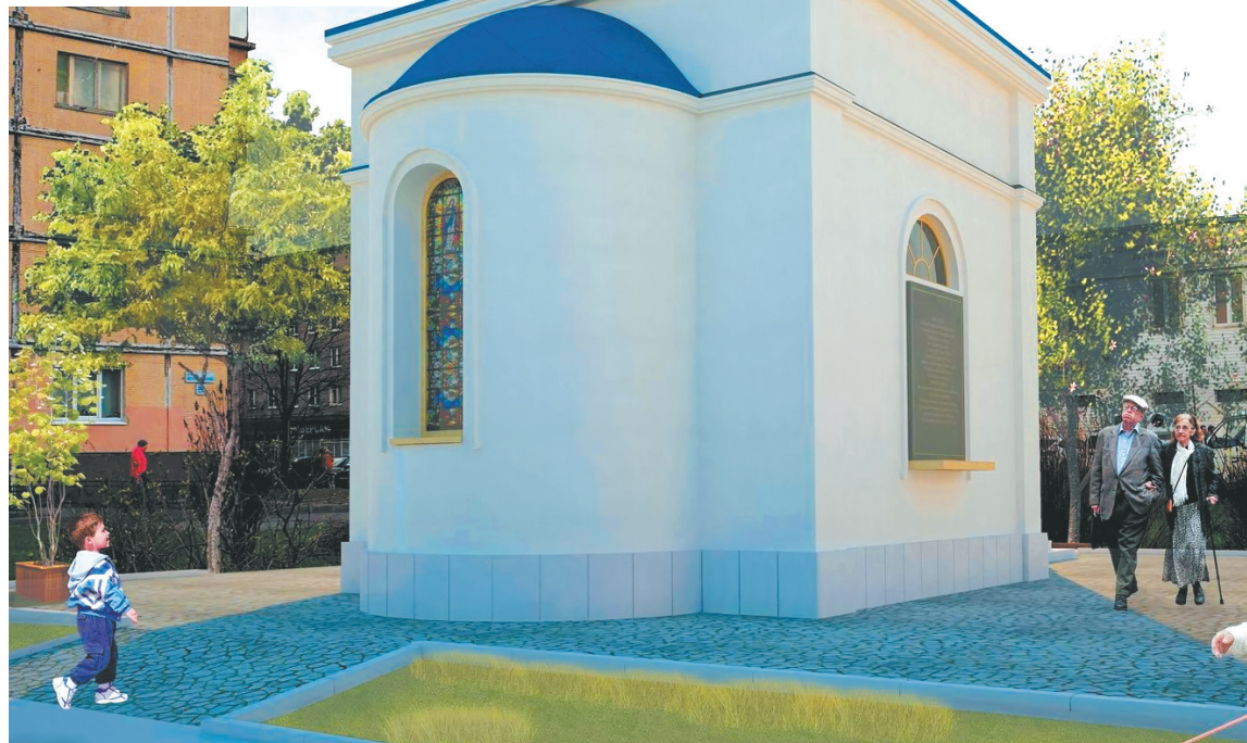
Жители района верят, что этот проект часовни скоро станет реальностью.